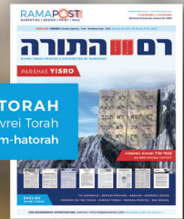
RAM HATORAH Compilation of Divrei Torah Ramapost.com/ram-hatorah