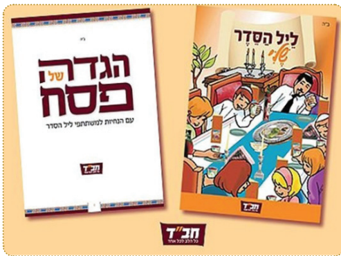
האיורים הפרדו מההגדה... הפקתה (במהדורה מעודכנת) שנעשו בהתאם להוראות הרבי

הרבי על הצורך לעשות את חדרם 'מקדש לה', שלכל ילד וילדה יהיה בחדר חומש וקופת-צדקה.