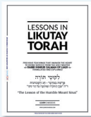
Likutay Torah (English)