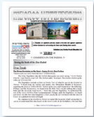
Meoros Hatzadikkim Dvar Torah & Weekly Yahrzeits (English) Ramapost.com/meoros-hatzadikkim

Please fill out the online form at RAMAPOST.COM/SUBSCRIBE-DIVREI-TORAH to subscribe. We ask that your free printed divrei torah be picked up every Friday at our Monsey (Rt 59) or Wesely Hills/Pomona location.