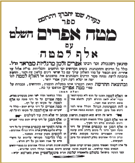
שער הספר 'מטה אפרים' מאת הגאון רבי אפרים זלמן מרגליות ז"ל

דברים אלו השמיע הרבי בהתועדות ש"פ האזינו שבת תשובה תשל"א ('תורת מנחם' כרך סב עמ' 31- הערה 67). בבואו לבאר את דברי רבינו הוקן בסידורו "אחר קריאת התורה יכין עצמו לתקוע בשופר ויאמר קאפטייל זה (מוזמר מז שבתהלים) ז' פעמים". אגב: בשיחות-קודש' תשל"א (כרך א' עמ' 12) נאמר